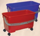
Eimer rot / blau mit Rollen