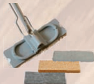
Multi Mop Baumwoll-Fransen Schwamm/Schafwollpad